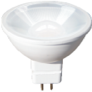
DICROICA LED LUNA 8 W